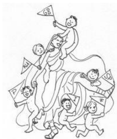
Mutter Latein und ihre Töchter

Latein ist eine über 3000 Jahre alte Sprache, die zwar nicht mehr aktiv gesprochen wird, die aber unsere Sprachen bis heute geprägt hat. Viele lateinische Wörter in unseren modernen Sprachen gehen auf das Lateinische zurück, und die Grammatik des Lateinischen ist das Gerüst für unsere Sprachen heute. Daher werden im Unterricht immer wieder Bezüge zu Deutsch, Englisch und auch Französisch und Spanisch geschaffen.