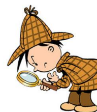
Mit Latein zum Sprachdetektiv werden

Das Lateinische wird i.d.R. so ausgesprochen, wie es geschrieben wird. Der Unterricht besteht darin, lateinische Texte zu entschlüsseln, d.h. vom Lateinischen ins Deutsche zu übersetzen. So trainiert man das Gespür für die eigene Sprache, Schwierigkeiten mit Aussprache und Rechtschreibung der Fremdsprache entfallen. Gleichzeitig werden Genauigkeit, Durchhaltevermögen und Beharrlichkeit trainiert. Verschiedene Lerntechniken für Vokabular und Grammatik wirken unterstützend auch für andere Fächer.